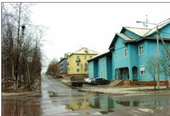
Здание Управления каскада Нивских ГЭС