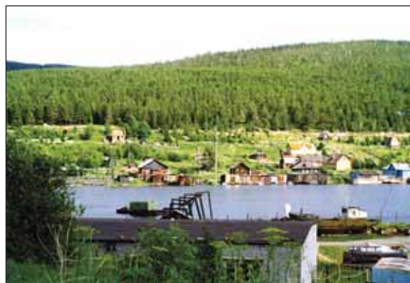
Вид на Зареку