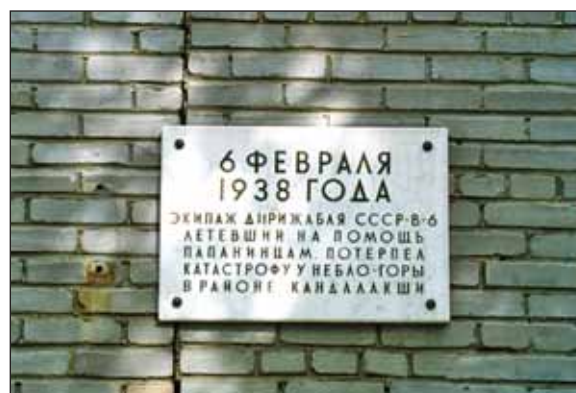
Памятная доска в честь погибших пилотов дирижабля «СССР-В-6»