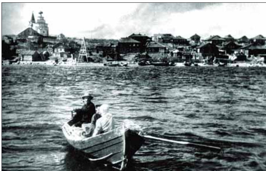
Устье реки Нивы. Вид на правобережную часть города

«Партер»; их собирали на месте российские и американские специалисты.