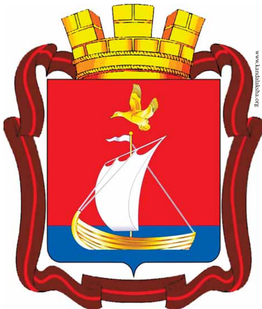
Герб города Кандалакши, утвержденный в 2008 году

О довоенном прошлом этого старинного города Мурманской области