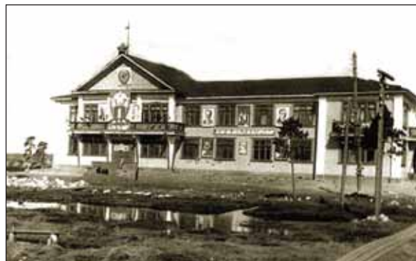
Клуб имени двадцатилетия Октября в поселке Нива-3