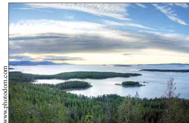
Рассвет над Белым морем

Наконец кое-как за хозяином забора и его работником я добрался до последней верши. Тут от помоста был устроен небольшой настил над вершей. <...> В настиле устроено горизонтальное окно, сквозь которое видно вершу. К краю последней прикреплены два вертикальные бревна. Их поднимают вверх, они, в свою очередь, тянут вершу. Первая оказалась пустою, ее опустили вниз и пошли назад к средней. Тут приподняли также бревна и <...> оказалась рыба. Тотчас же сверху бросили вниз веревку, к концам которой были прикреплены крючья, которые и зацепили за обе стороны верши. <...> Вверху приподняли на одну сажень от помоста. Кумжи, как обсохли, тотчас же стали биться. Они быстро и порывисто скользили во все стороны, грузно шлепались боками о стенки верши.