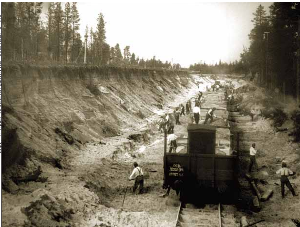
Строительство Мурманской железной дороги. Фотография 1915 года

http://www.papovoz.com/newgallery/?ID=58830&LANG=RU