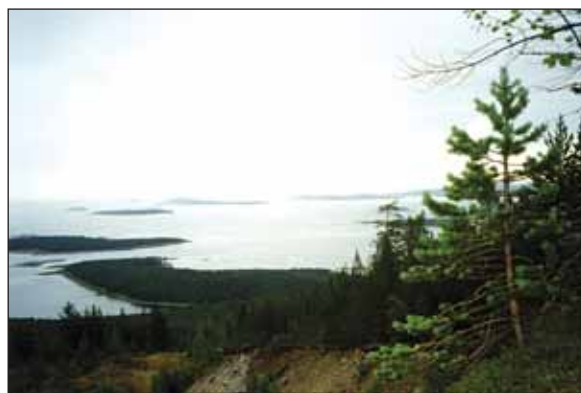
Вид на Кандалакисский залив. 2004 год