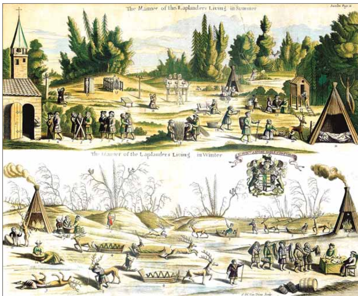
Жизнь лопарей летом и зимой. Иллюстрация из атласа М. Питта (Оксфорд, около 1680 года)

Что же касается второго названия монастыря — Кокуев, его появлению предшествовали следующие события. В действительности собственно Кокуев (Порьегубский) во имя Рождества Пресвятой Богородицы монастырь располагался на значительном удалении от Кандалакши, в 80 с лишним километрах от устья Нивы на острове при входе в Порью губу. В 1563 году он еще упоминается