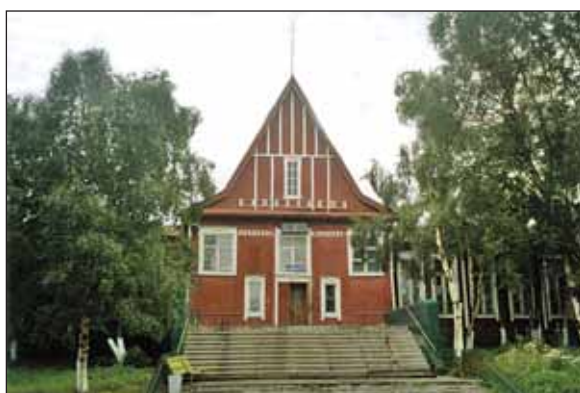
Здание железнодорожного вокзала, восстановленное после Великой Отечественной войны