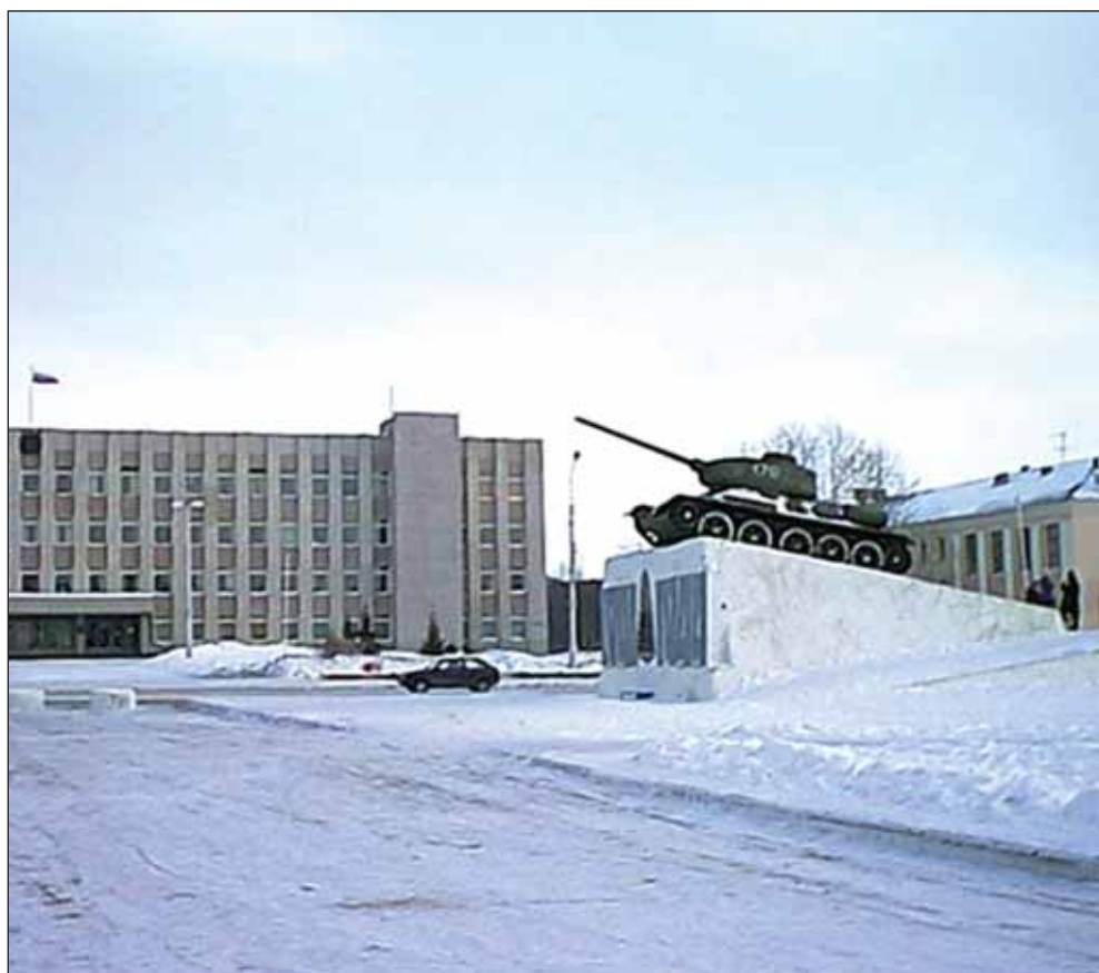
Кандалакша. Мемориал на центральной площади

В 1984 году за героизм, проявленный жителями Кандалакши во время Великой Отечественной войны, город был награжден орденом Отечественной войны I степени.