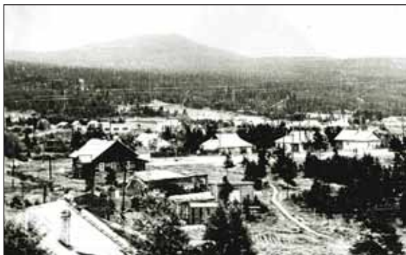
Левобережная часть города. Улица Набережная

Фотографии 1950—1960-х годов