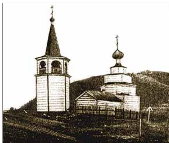
Церковь Рождества Иоанна Предтечи в селе Кандалакша.

На протяжении веков основными занятиями жителей Кандалакши были промыслы на море, реках и в лесах. Солеварение (соль — так называемая «морянка» — добывалась здесь из морской воды), которое