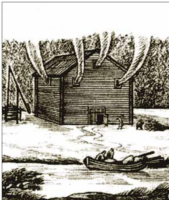
Иллюстрация из трехтомника И. Ф. Ушакова (Т. 2. Мурманск, 1997)

в XV–XVII столетиях являлось основой благополучия обитателей Кандалакшского побережья, полностью исчезло в первой четверти XVIII века с появлением на рынке более дешевой соли-«пермянки», выпаривавшейся из скважин соляных месторождений Пермского края. Утратили свое значение добыча речного жемчуга и ломка слюды в местных карьерах. Взамен в Кандалакшской губе начал развиваться сельдяной промысел. Кандалакша, наряду с селами Сорокой (современный город Беломорск), Керетью, Ковдой и Княжьей Губой, представляла собой один из основных центров этого промысла на Белом море. Особенно доходным был весенний («егорьевский») подледный лов. На него в апреле выходили все жители Кандалакши. Разместившись в избушках по берегам залива, промысловики бдительно следили за тем, когда и где пойдет на нерест сельдь. Сторожа посменно дежурили у специально проделанных во льду лунок. Как только начинался массовый ход рыбы, в проруби опускались невода. В летнее время лов производился с лодок. Ежегодно кандалакшане продавали более тысячи бочек соленой сельди.