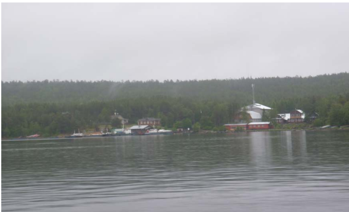
Километров через 5-6 показался наш кордон. Направо за мысом – в километре – Нильма-губа, налево наш домик.