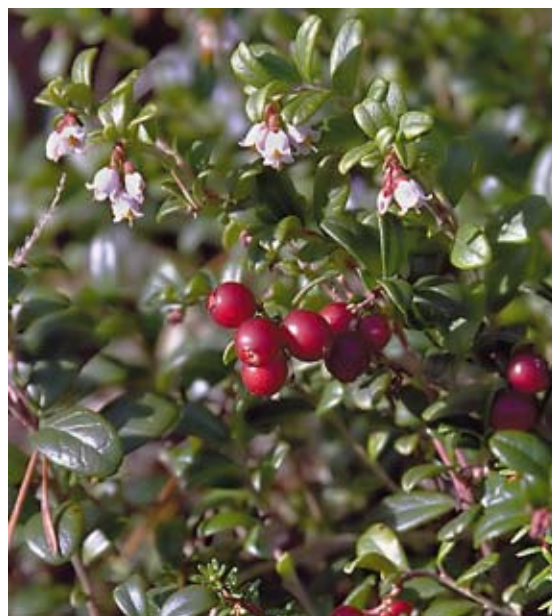
Эти цветки брусники не станут ягодами.

Рябина на нижнем снимке тоже была спровоцирована ненормально теплой осенью, правда, цветы появились лишь на одиночных деревьях и все равно скоро завяли, хотя погода продолжала оставаться теплой.